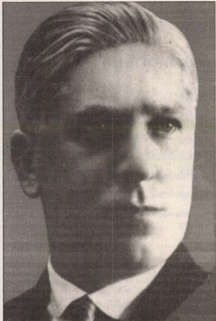
Bajcsy-Zsilinszky Endre is bűnös?

tosságra nem képes. Ezzel nem akartam most megjelent könyvét bírálni: erre nem vagyok illetékes (majd megteszi a szakkritika), de hogy ez több, mint feltevés, azt bizonyítja, hogy egy neves történész (Bajcsy-Zsilinszky-kutató!) már 1970-ben ezt írta a Történelmi Szemle (4. sz.): „Évek óta folyik már történelmszövegekben a meg-megújuló konfrontáció a nemes törekvésű Bajcsy-Zsilinszky-kutató (ti. V. K. — P. G. P.) sajnos kritikátlanságra hajlamos szemléletével, amelyet hovatovább hőskultusz jellemez... A hősével szembeni kritikátlan állásfoglalás fogyatékosága károsan hatnak módszereire is: Bajcsy-Zsilinszky korai útját szinte minden tekintetben és mindenáron tisztázni kívánó igyekezetében erőltetett magyarázatokhoz, egyoldalú idézésekhez folyamodik... Bajcsy-Zsilinszky emlékének nem tud anélkül adózni, hogy ne sértse Áchim emléket... Vigh Károlyt abban lehet